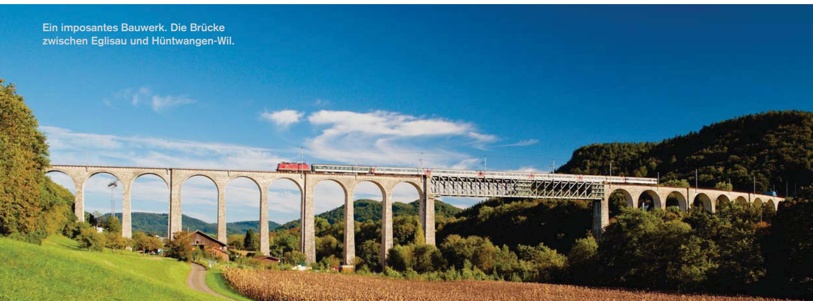
Ein imposantes Bauwerk. Die Brücke zwischen Eglisau und Hüntwangen-Wil.

Über die definitiven Ergebnisse des oben vorgestellten Monitorings und die dadurch angezeigten Massnahmen informiert «der bauingenieur», sobald die Messergebnisse vorliegen.